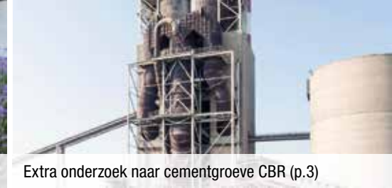
Extra onderzoek naar cementgroeve CBR (p.3)