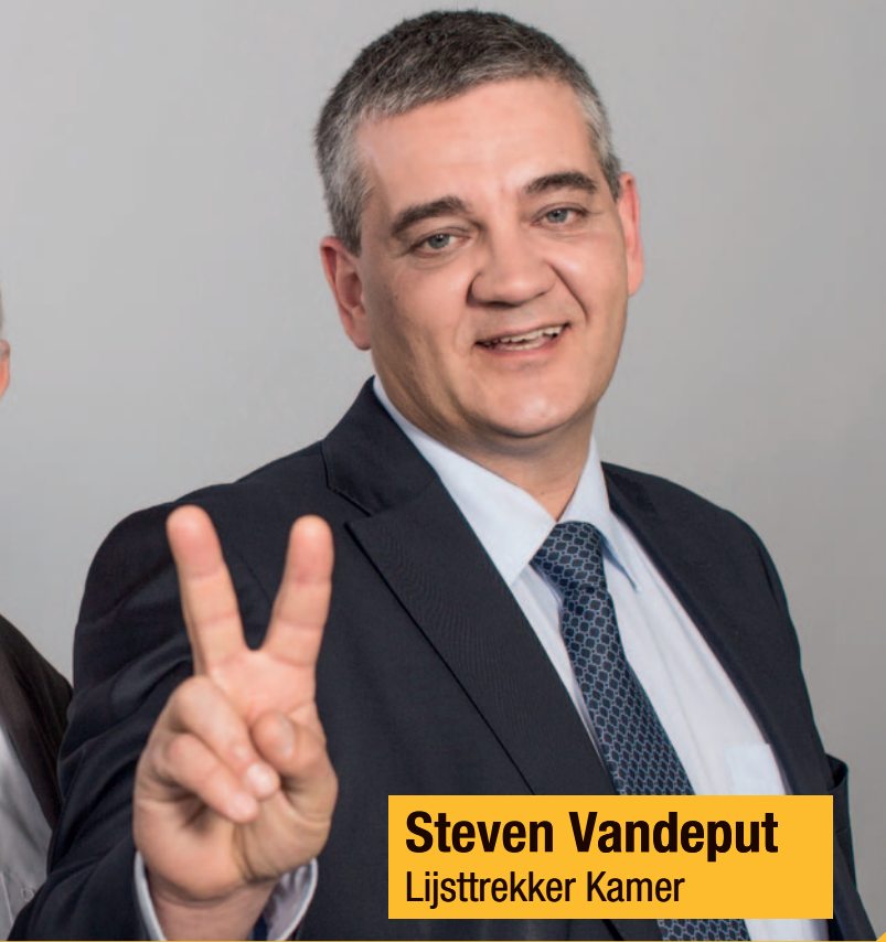
Steven Vandeput Lijsttrekker Kamer

Politici zijn er voor de burgers, de verenigingen, de ondernemingen, en niet omgekeerd. Politici moeten zuinig en doeltreffend omspringen met de beschikbare overheidsmiddelen, met úw geld.