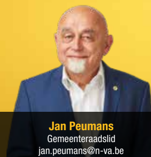
Jan Peumans Gemeenteraadslid jan.peumans@n-va.be

Heeft u vragen of opmerkingen? Contacteer onze raadsleden